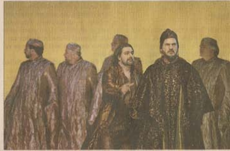
Scène uit I due Foscari van de Nationale Reisopera.